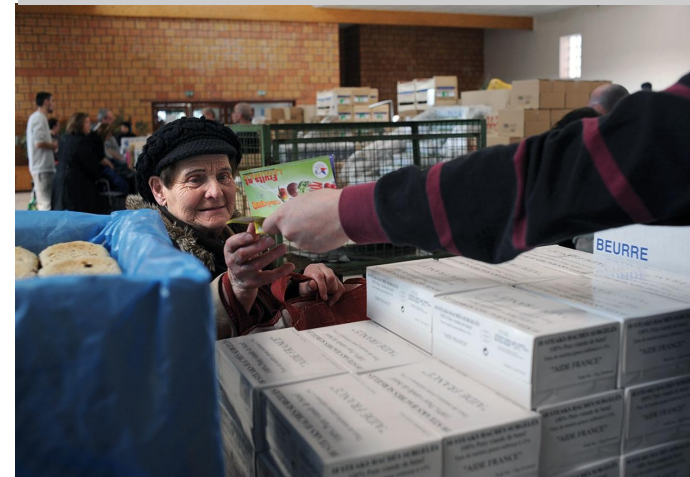
Dans les permanences d'accueil du SPF, les bénévoles mesurent l'ampleur de la crise au nombre croissant de personnes sollicitant l'aide alimentaire.

nombre de familles nobles ont refait surface à la Restauration et occupent de nos jours des positions importantes dans les banques ou la finance