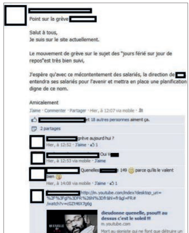
Ci-dessus la capture d'écran de la page d'un délégué CGT

Il est donc important d'avoir une réaction (message privé, discussion dans le syndicat...), et suppression s'il s'agit d'un commentaire ou média d'une organisation CGT. Plus il y aura de camarades qui réagissent, plus nous montrerons que le refus des idées d'extrême-droite est fort !